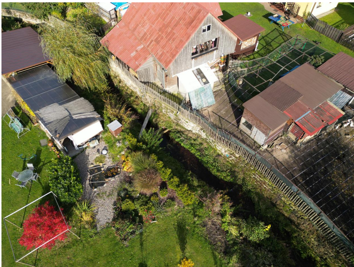
Foto č. 5 – Pohled proti proudu na úsek se zdí na levém břehu, stodola s přístavkem, který bude dočasně odstraněn