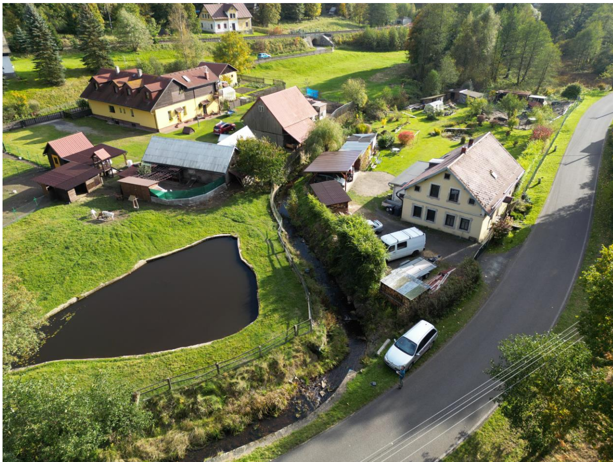
Foto č. 2 – Horní konec úseku, pohled pro proudu, místo přístupu ze silnice do koryta