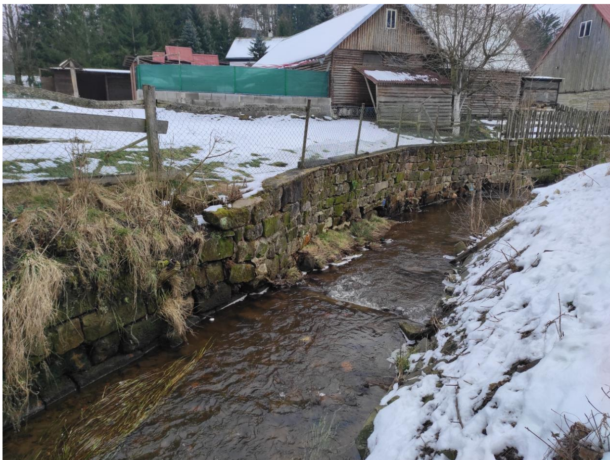
Foto č. 11 – Pohled po proudu na horní část úseku se zdí na levém břehu