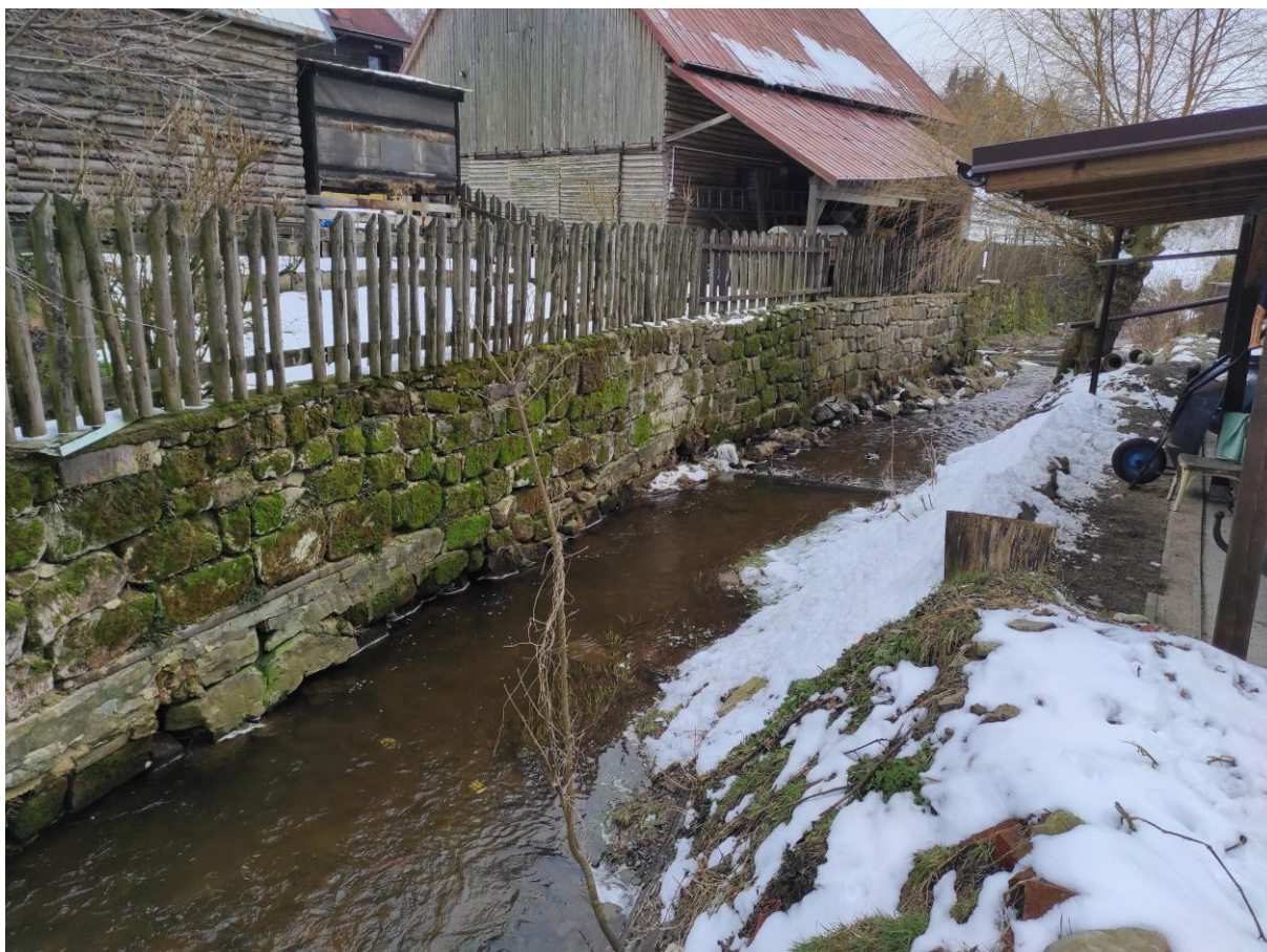
Foto č. 12 – Pohled po proudu od prostředka úseku se zdí na levém břehu