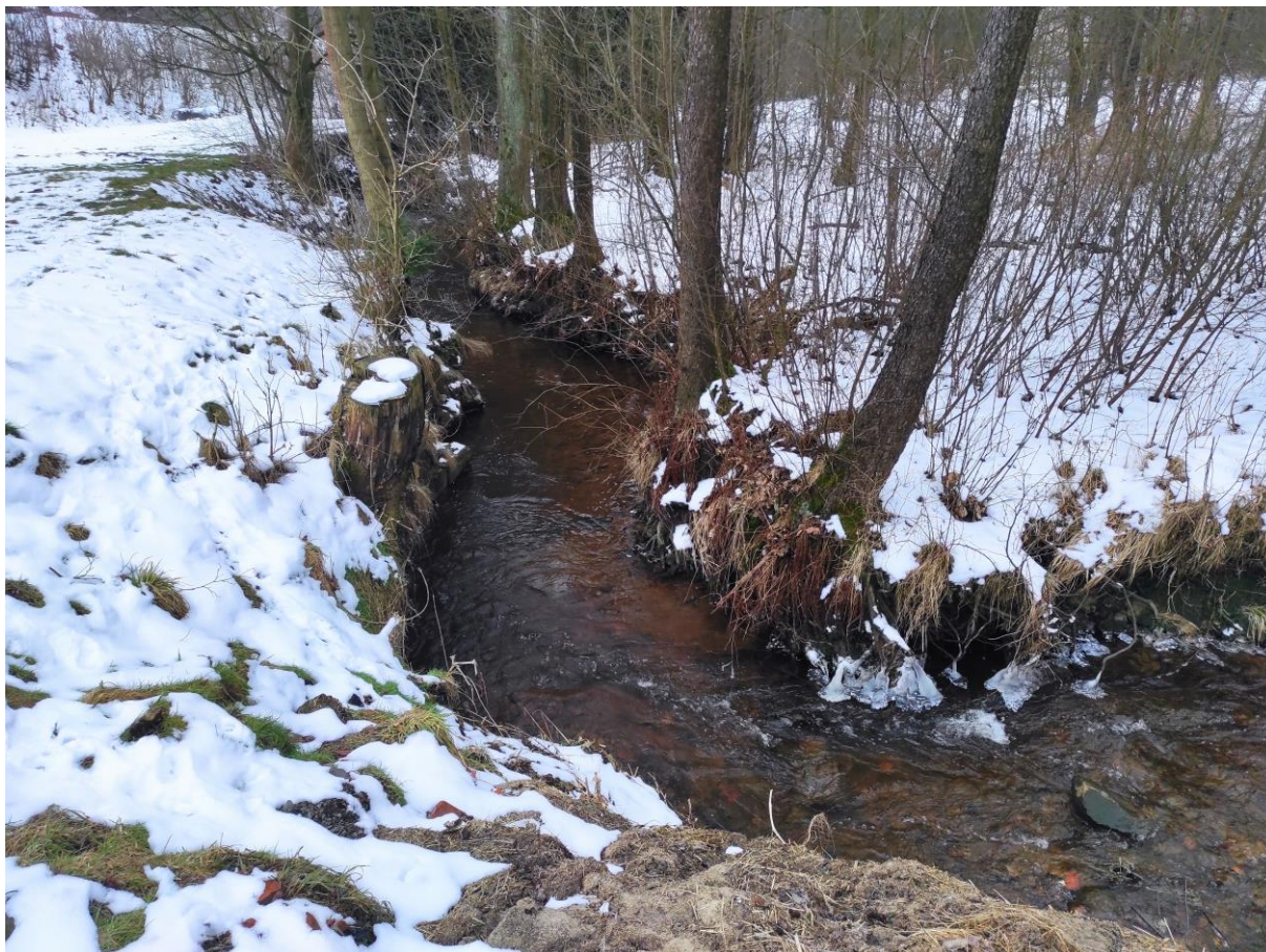
Foto č. 9 – Pohled po proudu na dolní konec úseku (dva stromy na pravém břehu budou odstraněny)