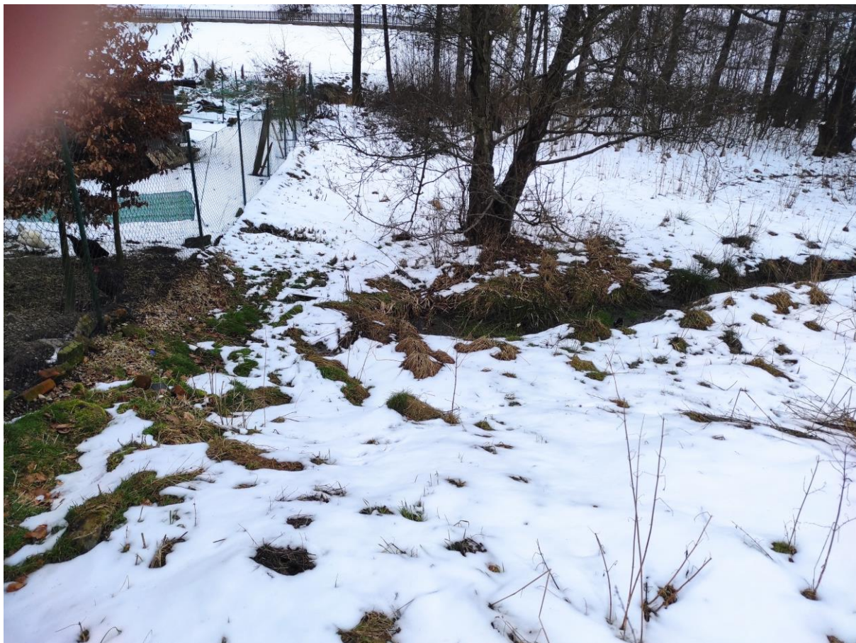
Foto č. 13 – Pohled na přístupový pás od silnice na dolním konci úseku