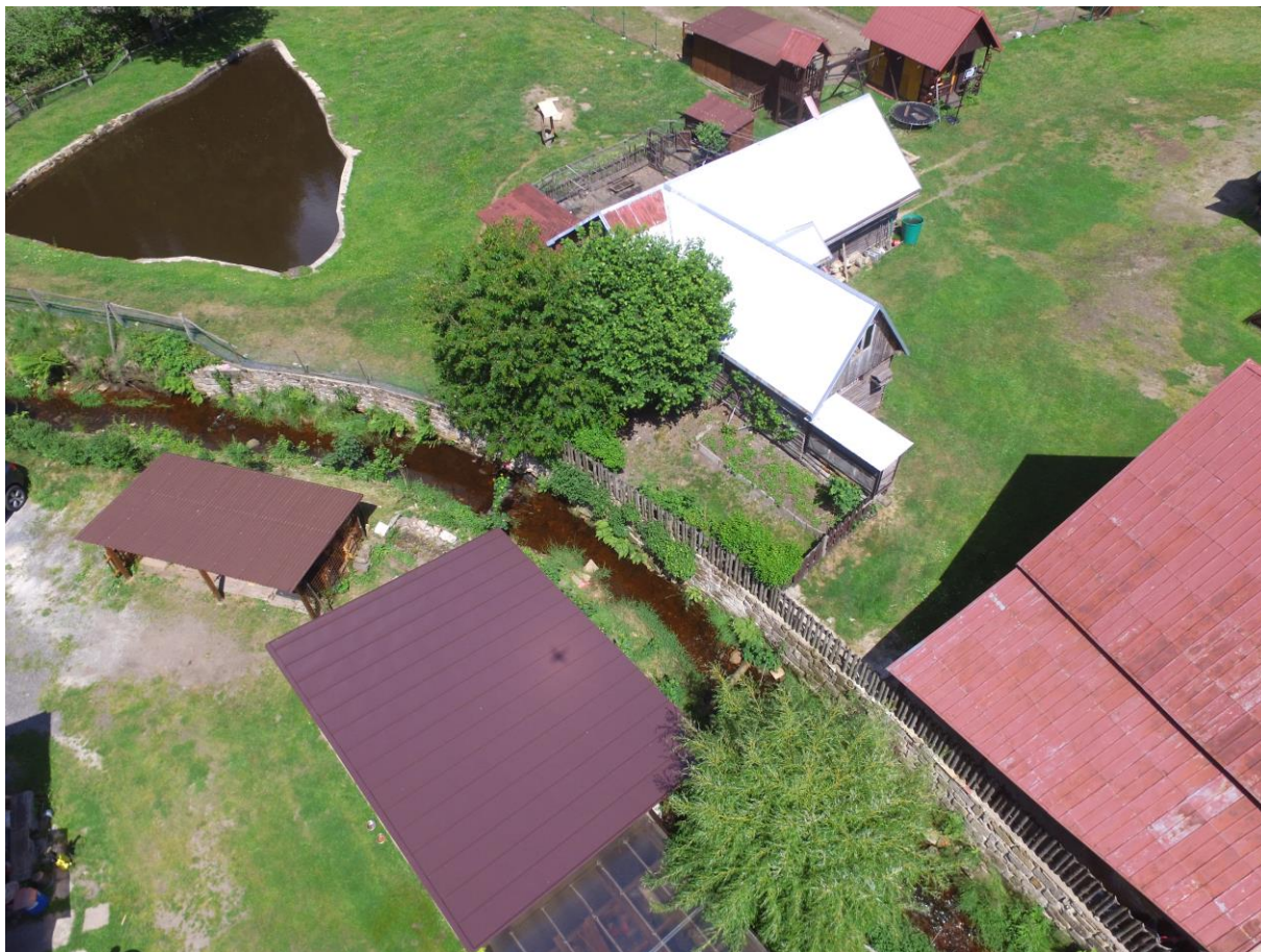
Foto č. 7 – Pohled proti proudu na horní část úseku se zdí na levém břehu